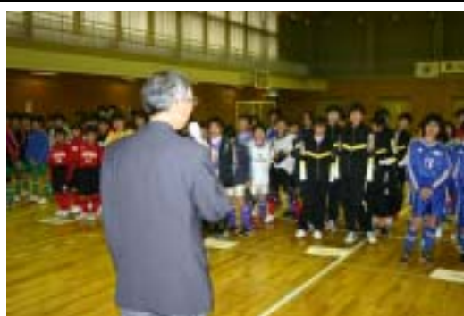
開会式で応援団事業の説明をしました