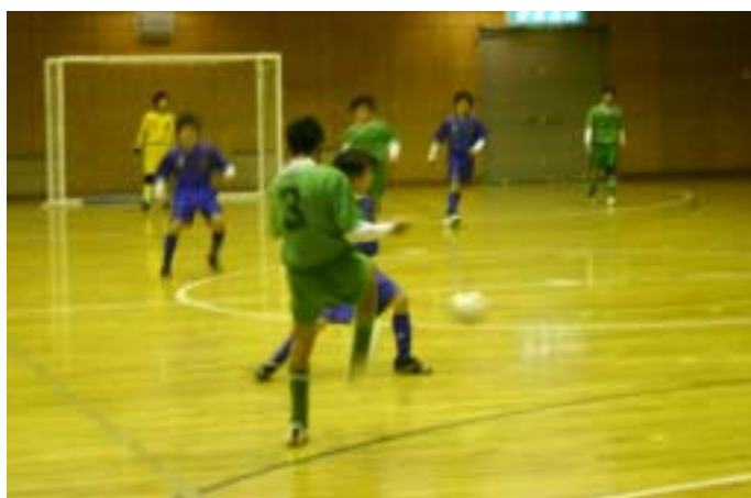
白熱するフットサルの試合！！