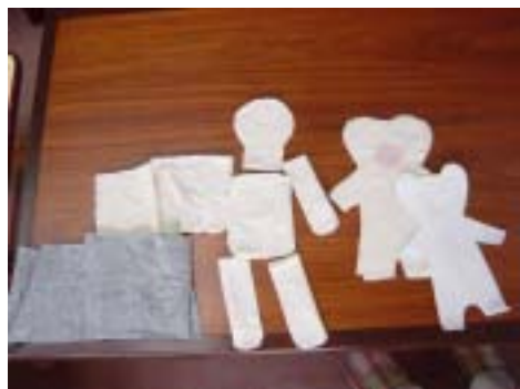
いただいた材料を