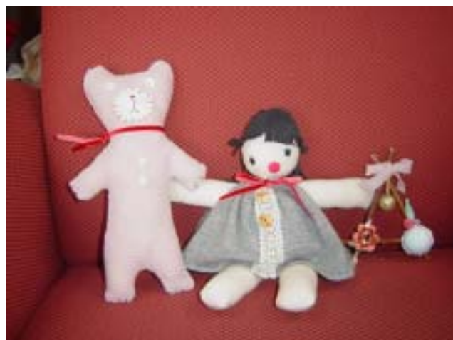
かわいいぬいぐるみやリースに