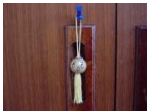
そろばんの玉は、ストラップにもなりました