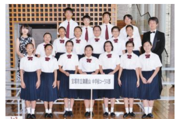
宝塚市立御殿山中学校 コーラス部