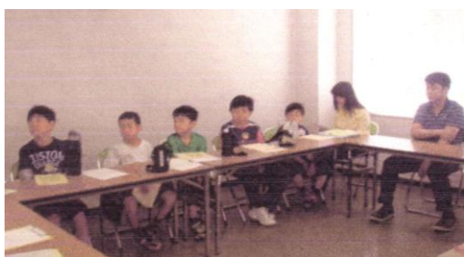
研修ではみんな、真剣な表情です