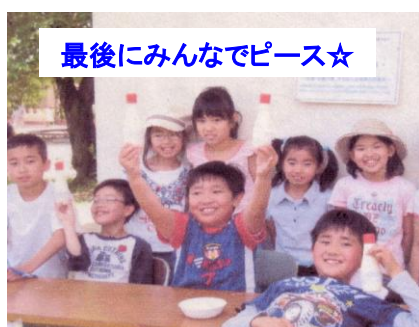
最後にみんなでピース☆