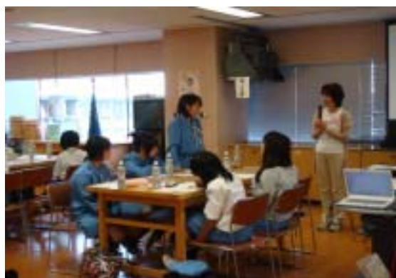
活発な意見がどんどん発表される!