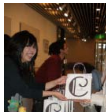
* Sound of Teen フェスティバル